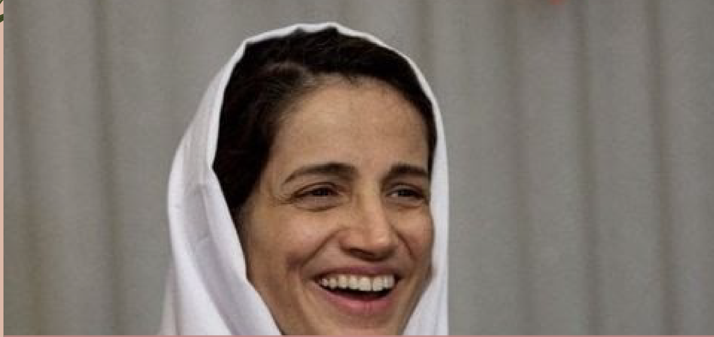
Una condanna a 33 anni di carcere per aver difeso i diritti civili e politici nell'Iran degli ayatollah. Nasrin Sotoudeh, avvocatessa e una delle più note attiviste iraniane per i diritti civili, è colpevole di "propaganda contro lo Stato", "istigazione alla corruzione e alla prostituzione", di "essere apparsa in pubblico senza hijab", dopo aver difeso decine di donne che si sono scoperte il capo per protestare contro il velo obbligatorio. Sotoudeh è nel carcere di Evin dal giugno 2018. (S.B. - 42 anni)

Non c'è miglior augurio di quello che mostra rispetto quotidiano verso una donna che semplicemente vive per realizzare i suoi sogni