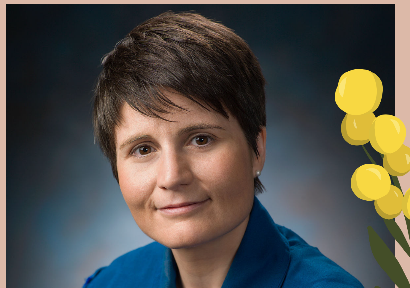
Samanta Cristoforetti è un'astronauta, aviatrice e ingegnere italiana, prima donna italiana negli equipaggi dell'Agenzia Spaziale Europea. Ha conseguito il record europeo e il record femminile di permanenza nello spazio in un singolo volo (199 giorni). (A.M. - 29 anni)