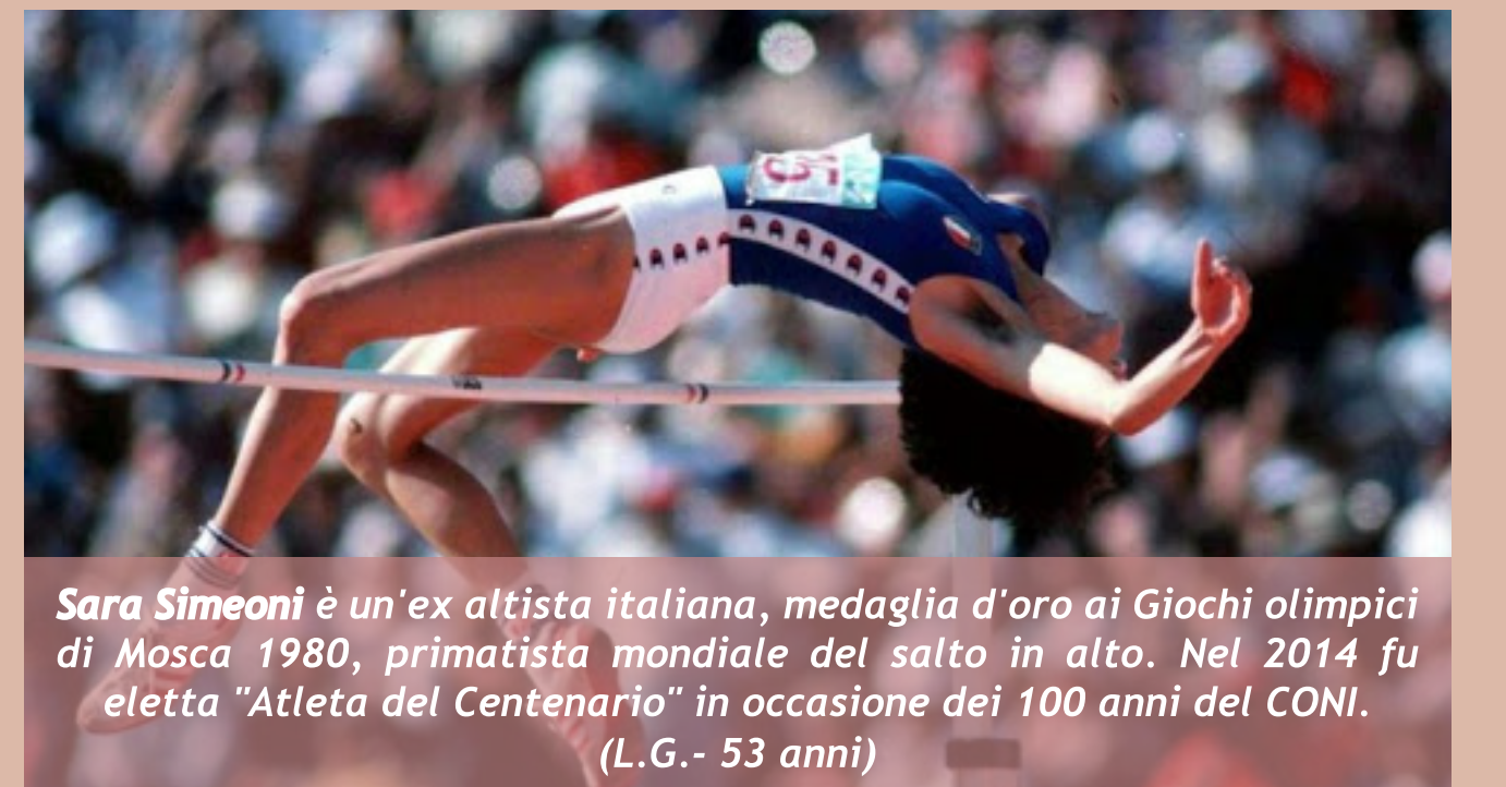
Sara Simeoni è un'ex altista italiana, medaglia d'oro ai Giochi olimpici di Mosca 1980, primatista mondiale del salto in alto. Nel 2014 fu eletta "Atleta del Centenario" in occasione dei 100 anni del CONI. (L.G. - 53 anni)