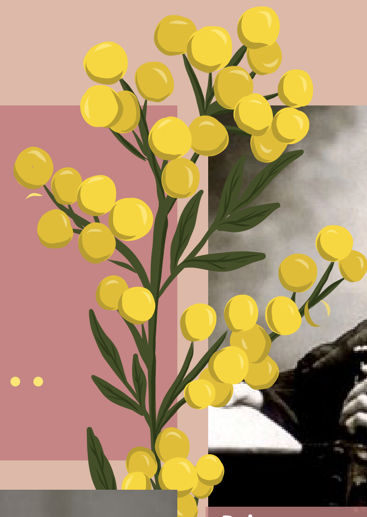
Prima scrittrice italiana e femminile del 900, Sibilla Aleramo, è anche femminista e pubblica nel 1906 "Una donna", che rappresenta il primo caposaldo del femminismo. (T.R. - 38 anni)

8 MARZO 2021 - Parlatemi di TE... Le vostre risposte