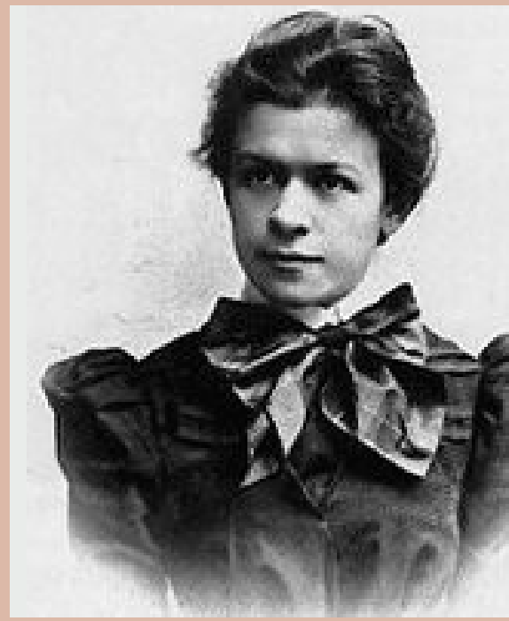
Mileva Marić Prima moglie di Albert Einstein, prima donna ad aver studiato Fisica al Politecnico di Zurigo. (D.D. - 59 anni)