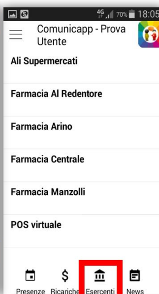
Sezione Lista Esercenti